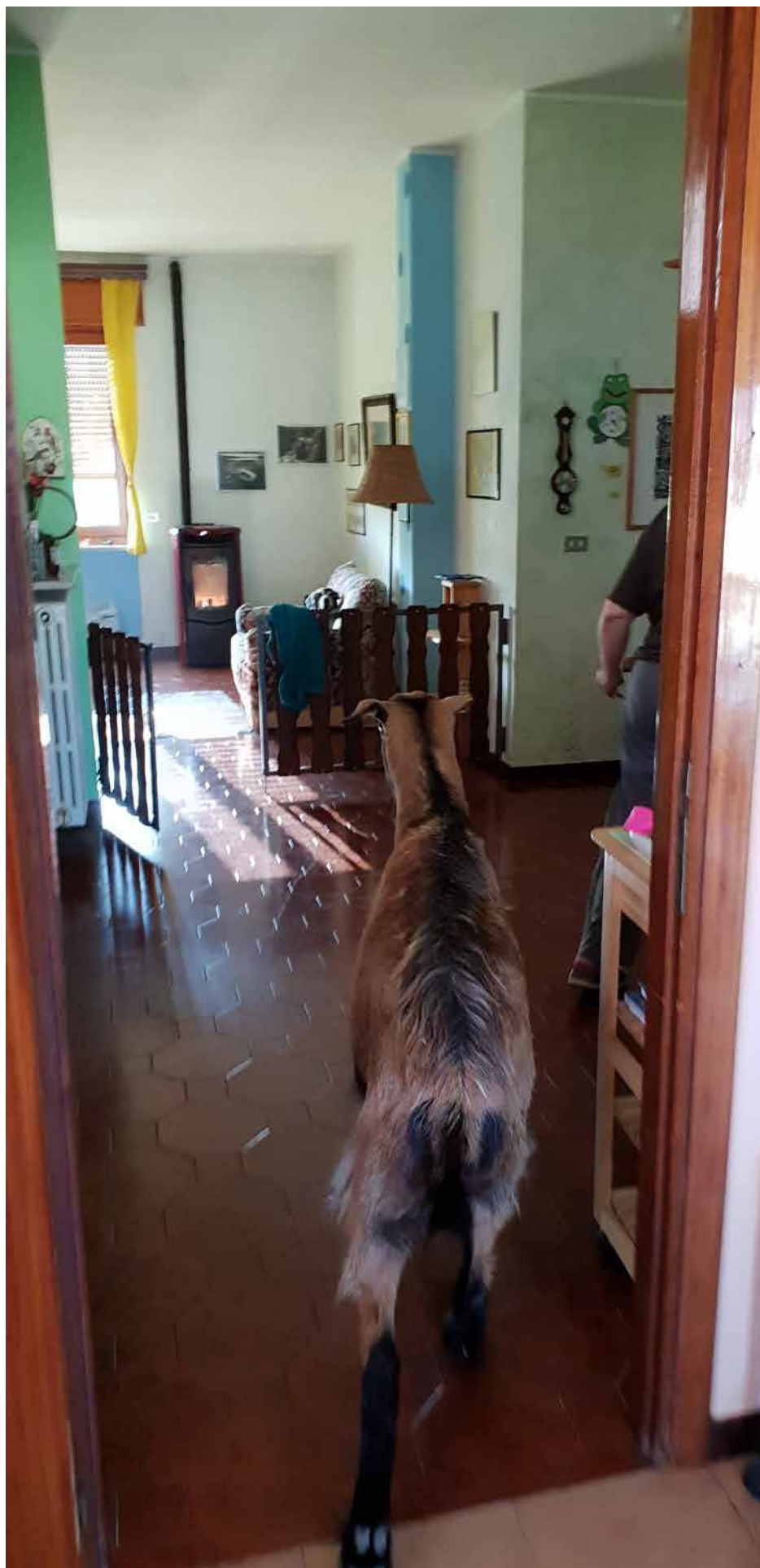
Milto in casa